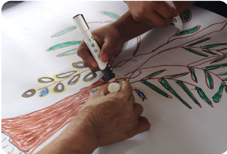
Imagen 3. Taller sobre conservación y germinación de semillas 1