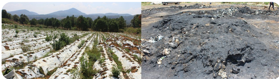
Imagen 2. Desechos de los plásticos agrícolas abandonados e incinerados por la empresa Agrícola Superior de Jacona en los terrenos comunales de Tumasüu

Sin embargo, mientras escribo estas líneas, han pasado más de tres años después de la primera movilización social y la empresa agrícola nunca se hizo responsable de las afectaciones causadas a la comunidad, el dinero pagado no significa en absoluto una reparación del daño ni ninguna compensación económica, fue sólo lo que la empresa le debía a la comunidad por las obras incumplidas. En marzo de 2021, algunos terrenos comunales todavía muestran plástico de acolchado y macro-túnel encima, hechos pedazos por el sol, el viento y la lluvia. Algunos comuneros no pudieron sembrar maíz en el ciclo agrícola 2019-2020 y los que sí sembraron tuvieron que limpiar ellos mismos sus terrenos.