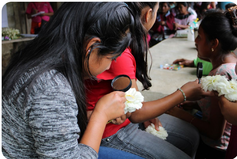
Imagen 4. Taller sobre conservación y germinación de semillas 2